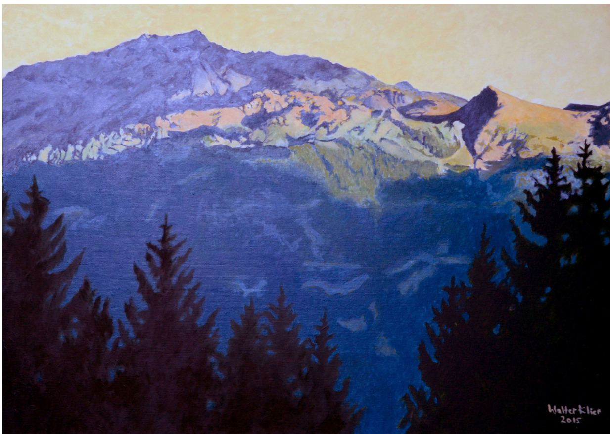
Glungezer_Abendlicht , 50 x 70 cm, Öl auf Leinwand, 2015 © Walter Klier