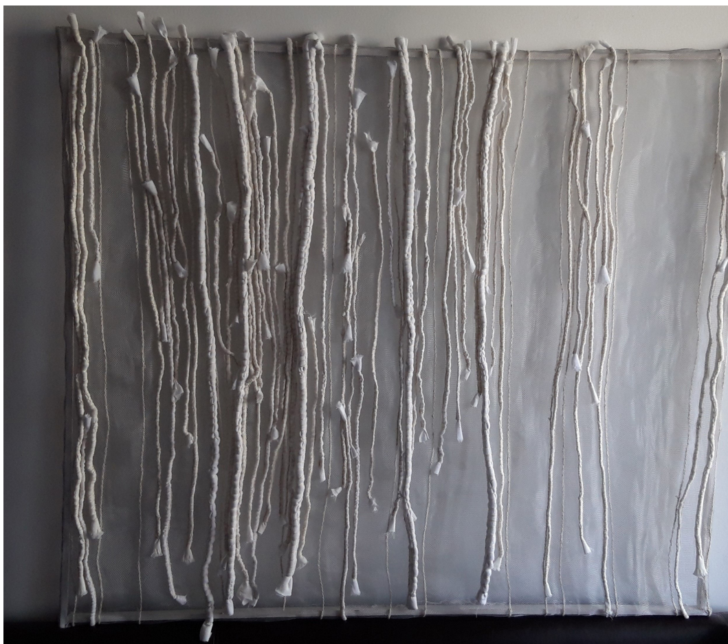
Textilien von Metall, Radierungen zum Thema Weben, 50 x 70 cm, Radierung, 2023 © Barbara Fuchs