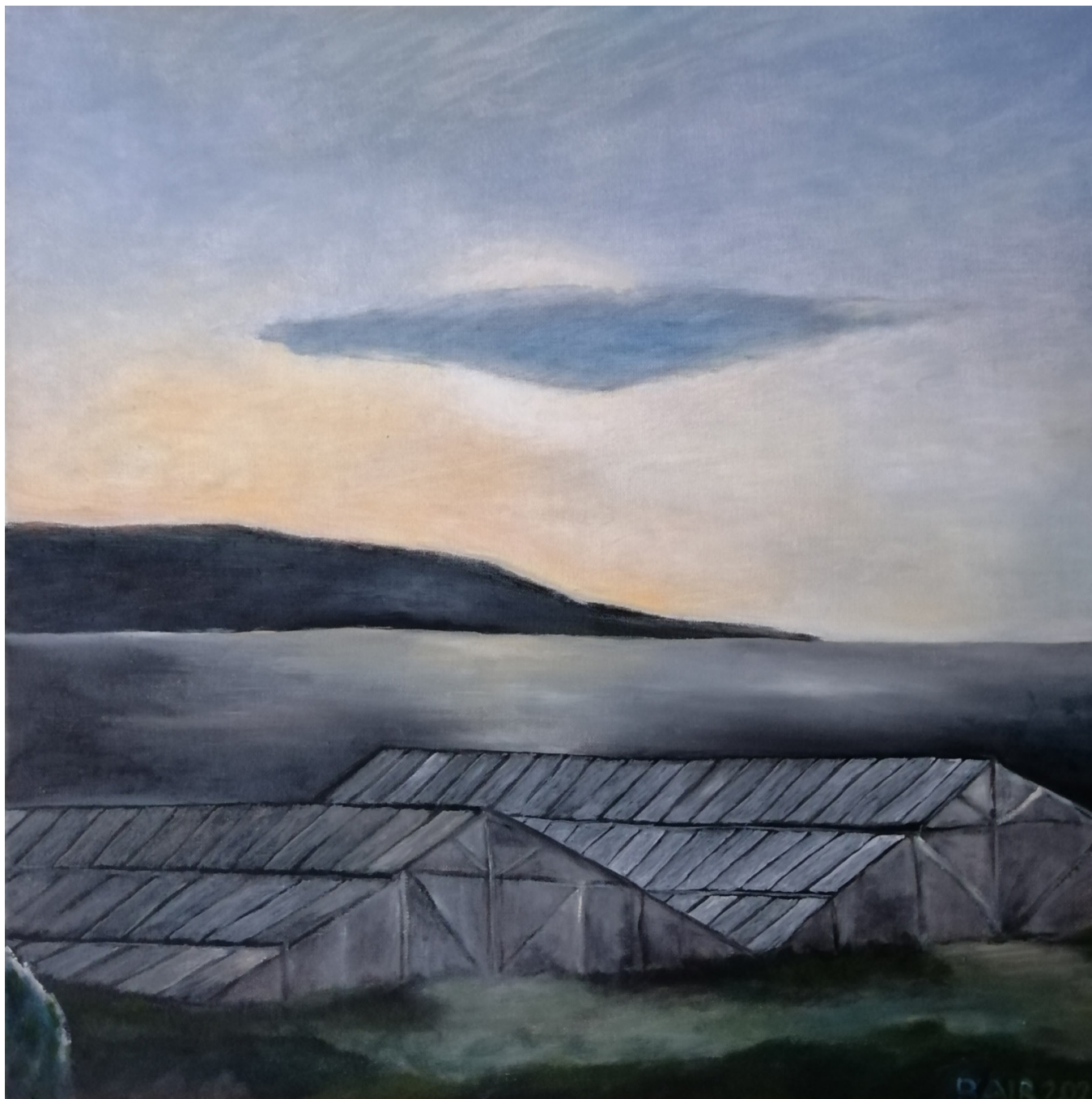
Glashäuser , 50 x 50 cm, Acryl auf Leinwand, 2020 © Johanna Bair