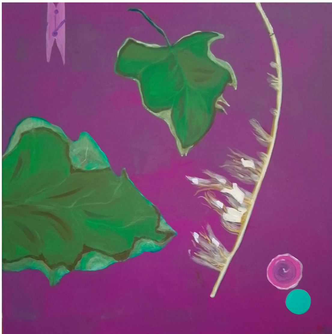
Aus der Serie sinnig_unsinnig, 50 x 50 cm, Acryl auf Leinwand, 2024, © Ina Luttinger