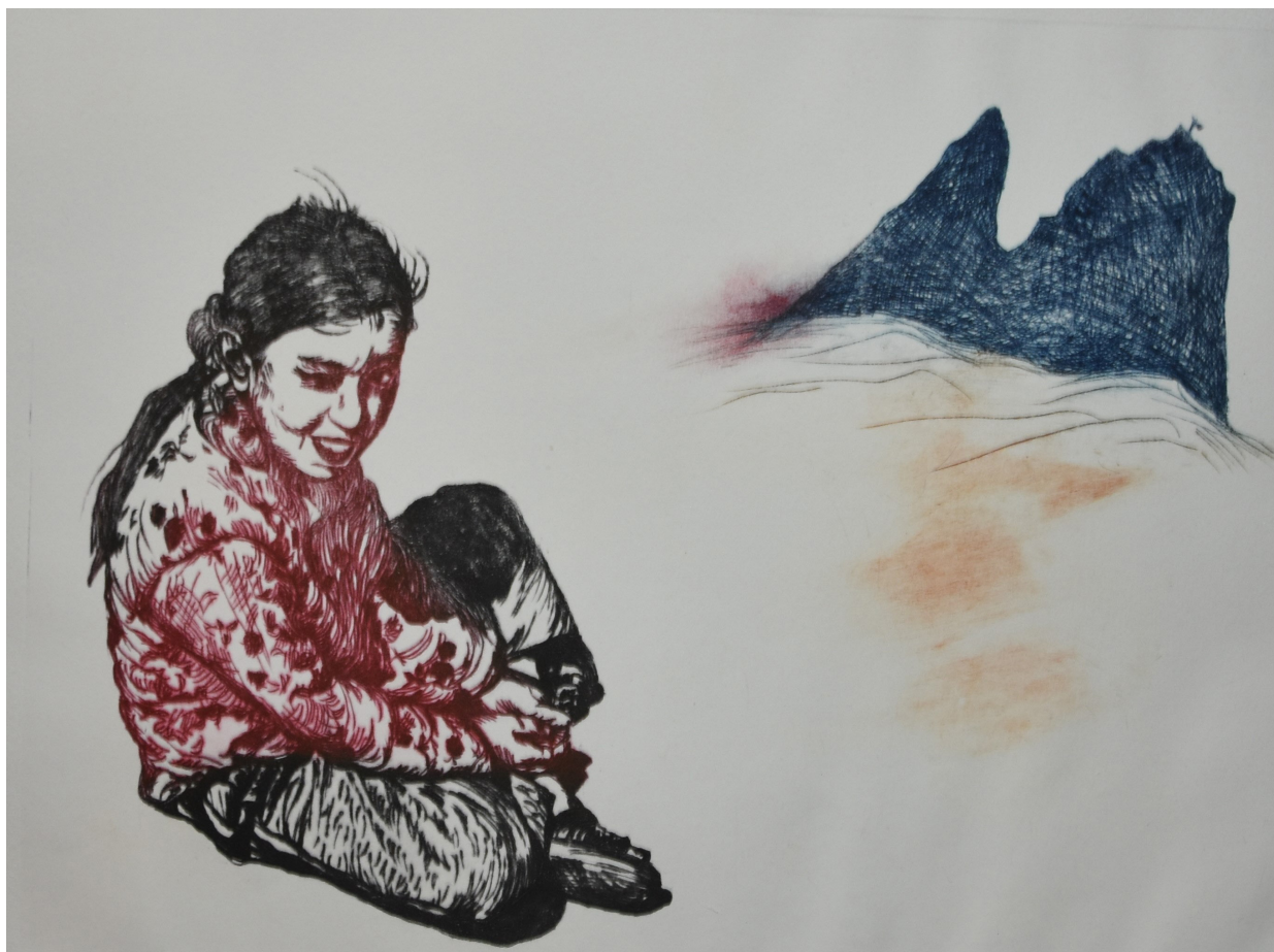
Zyklus „Was ist der Mensch“, 50 x 40 cm, Kaltnadel, 2023 © Elisabeth Melkonyan