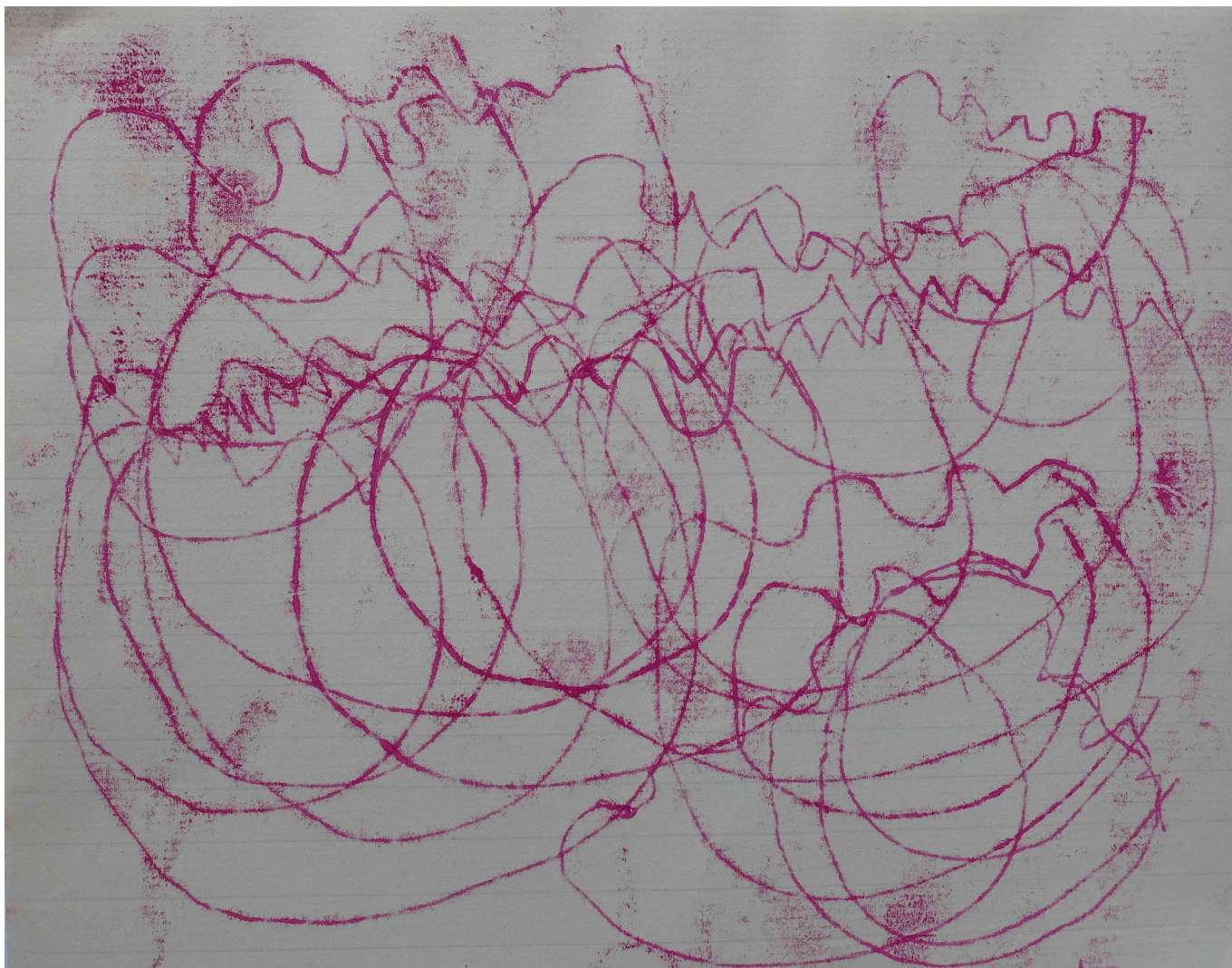
letter to the island 2 , 19 x 23 cm, Monotypie, 2024 © Anna Maria Achatz