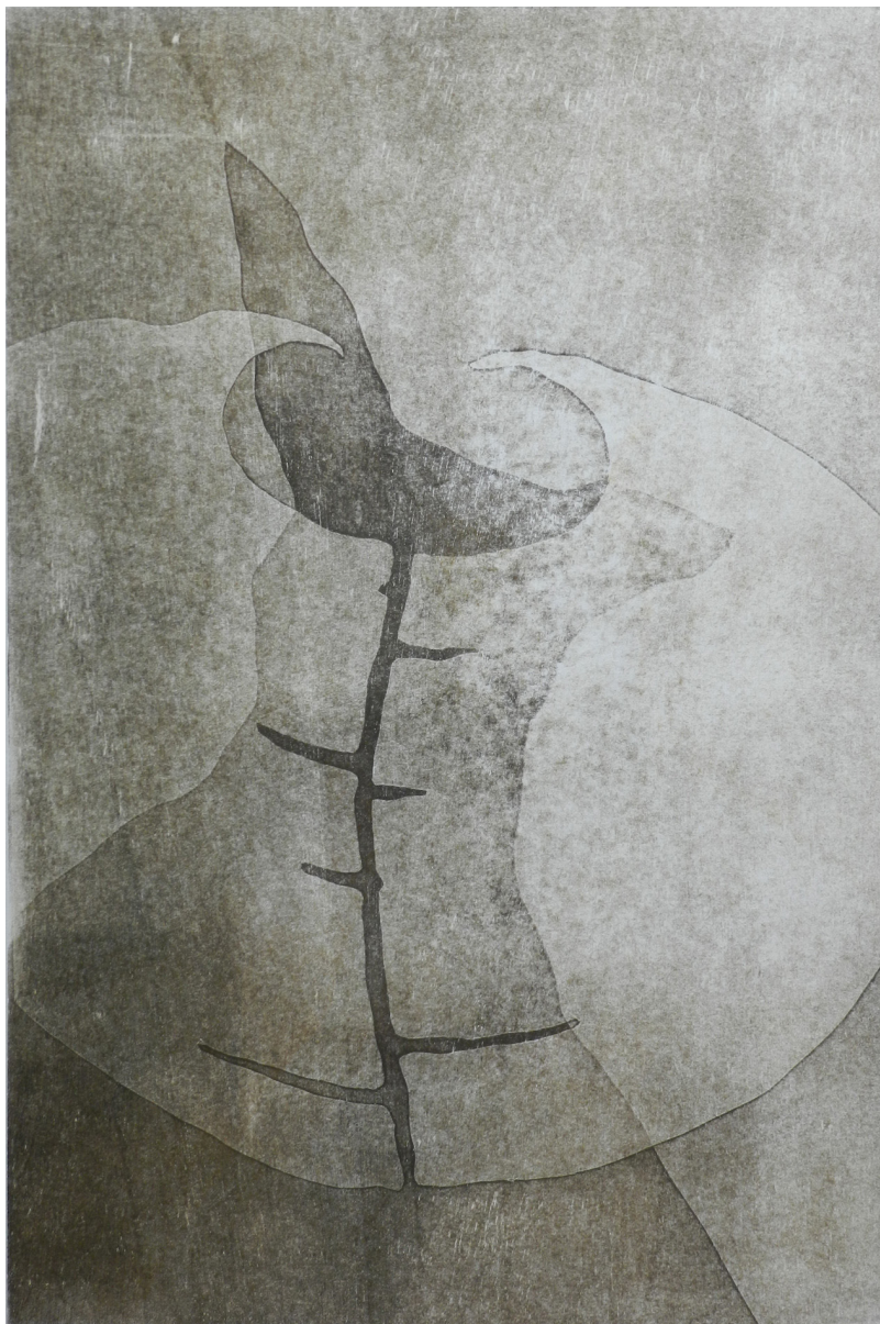
Momentum II , 40 x 60 cm, Woodblock Print, 2023 © Manfred Egger