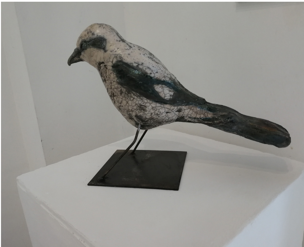
Bedrohtes_Raubwürger , 30 x 18 x 50 cm, Keramik und Metall, Raku, 2022 -23, © Elisabeth Ehart-Davies