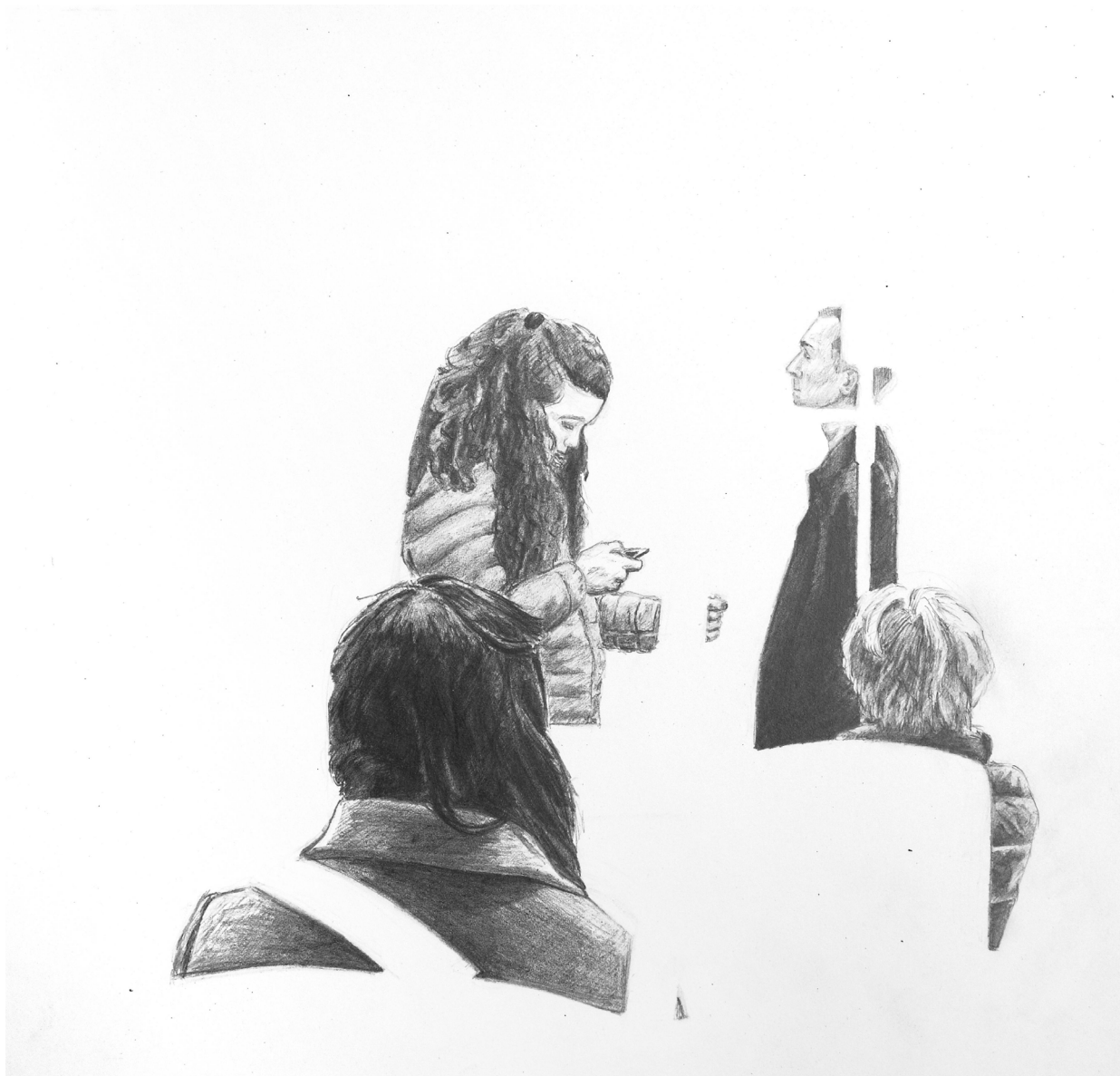
Unterwegs III , 20 x 21 cm, Bleistift, 2018 © Johannes Davies