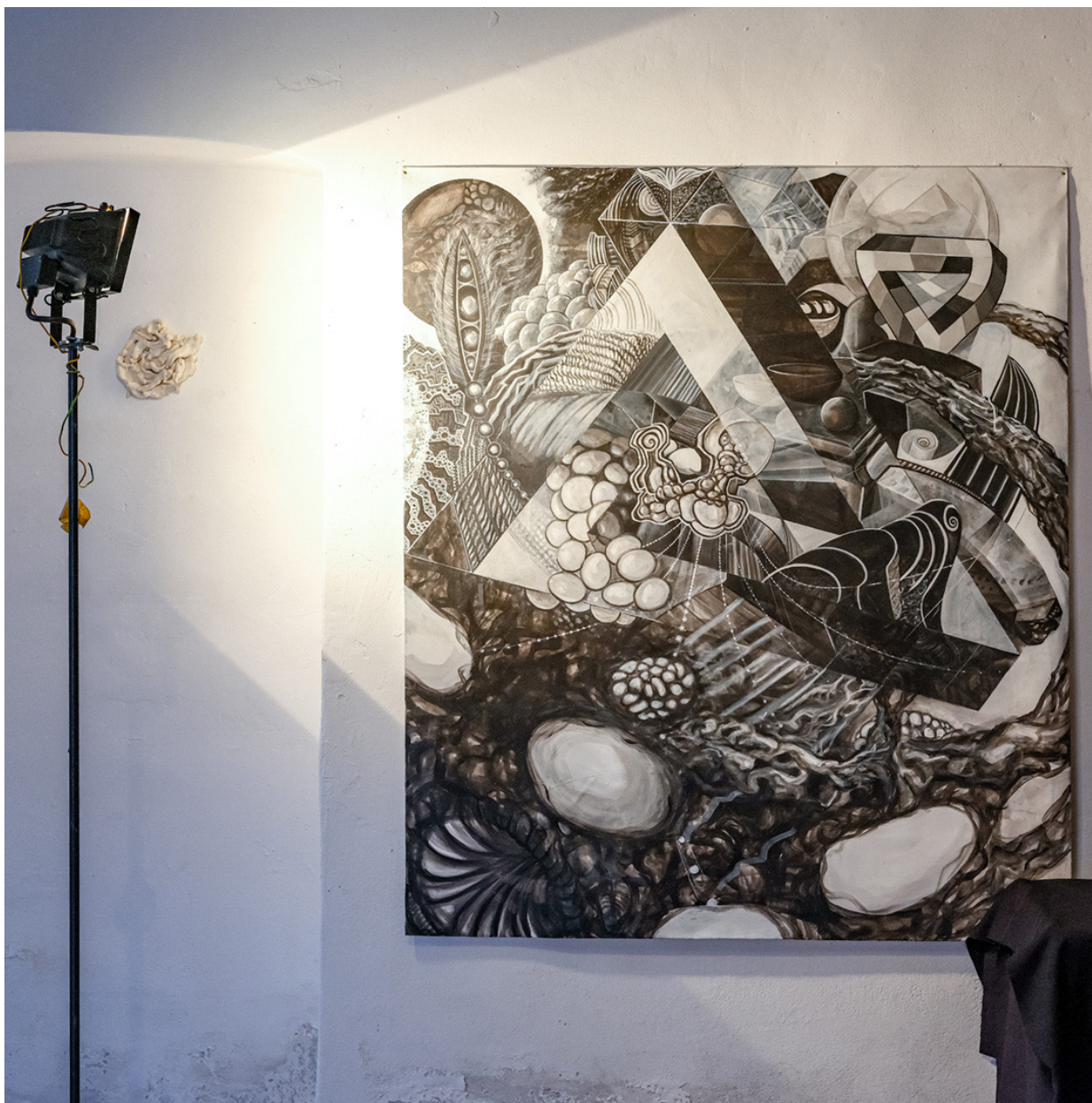
Raumwachsen, Rosa Roedelius mit Roland Siegele