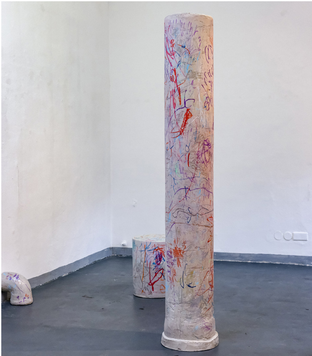
KRITZELN, Fanni Futterknecht