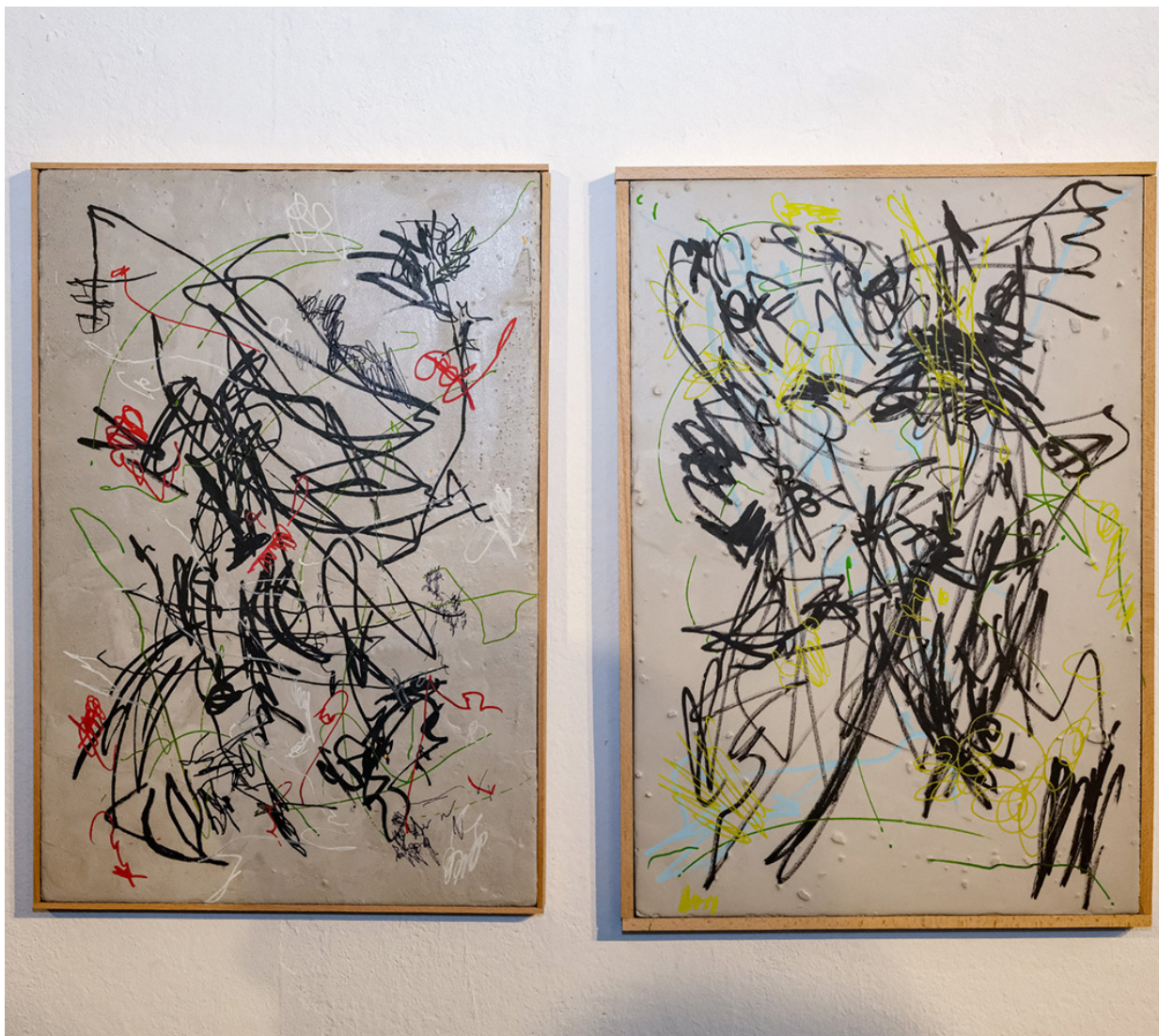
KRITZELN, Fanni Futterknecht