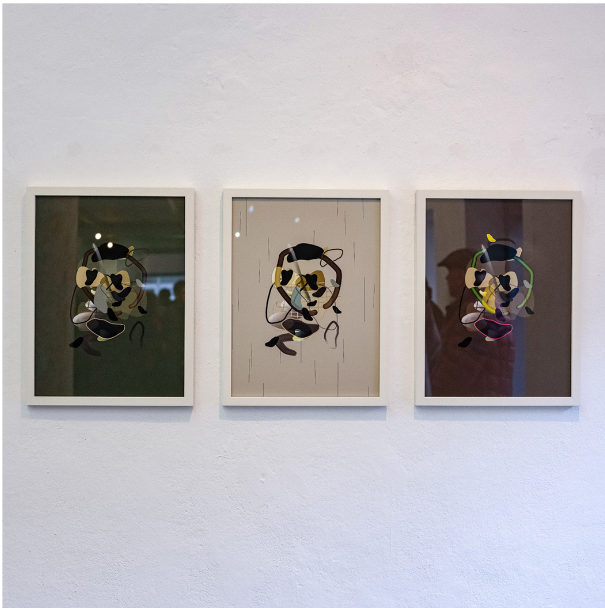
Katja Windau © Fotocredit: SIROSOLA, 2024