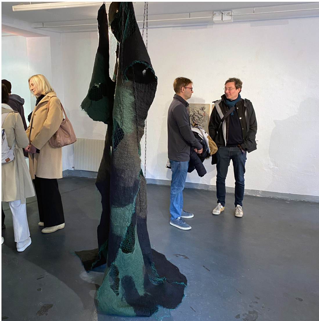
© Katja Windau, Zeitenwende , 2024