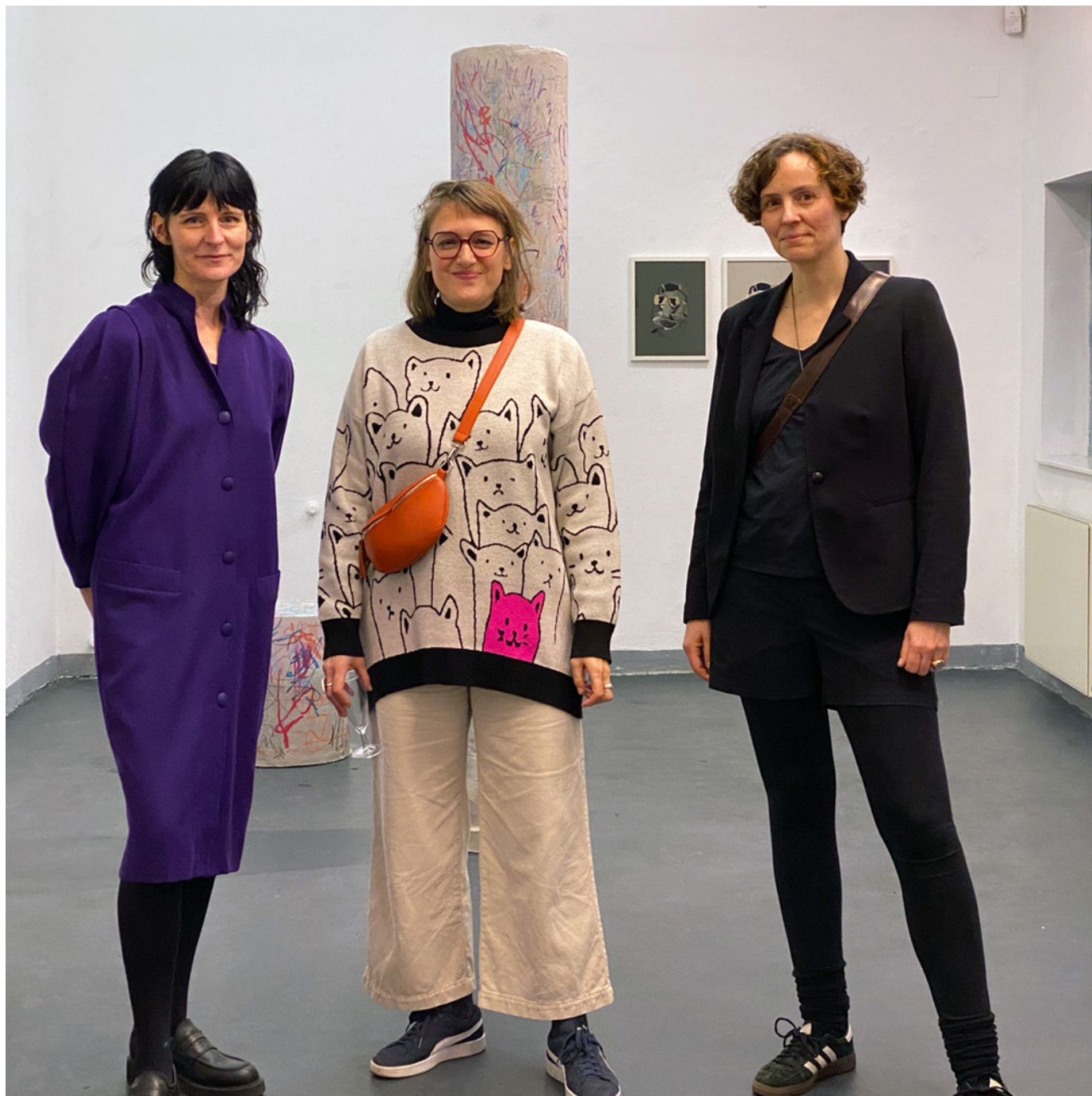
Katja Stecher, Fanni Futterknecht und Katja Windau